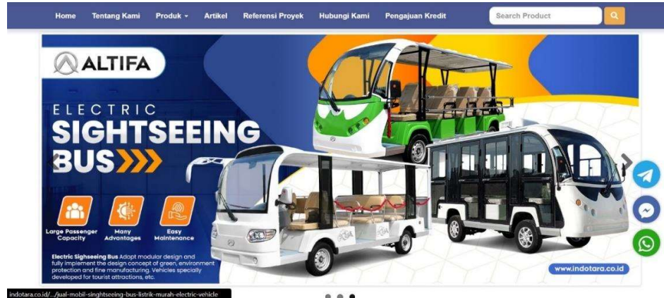
Gambar 1.1 Tampilan Website INDOTARA