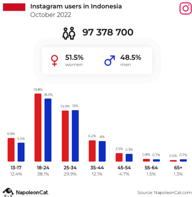
Gambar 1. 2

Pengguna Instagram di Indonesia pada bulan Oktober 2022