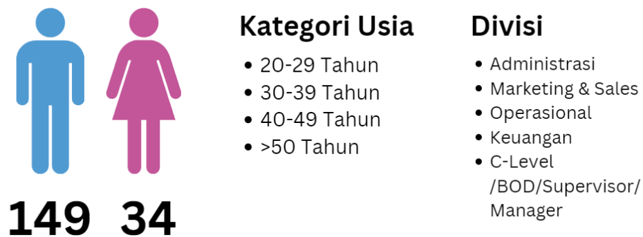
Gambar 1.3 Demografi Karyawan Grup Syaamil

menyusun penelitian kuantitatif terhadap karyawan di grup Syaamil untuk menjawab pertanyaan penelitian seperti yang tertuang dalam bab 1.3. Penelitian kualitatif ini akan melibatkan seluruh karyawan di grup Syaamil yang termasuk kedalam entitas bisnis penerbitan dan manufacturing dengan total 183 orang sebagai responden. Jumlah 183 responden ini merupakan sampling jenuh yang mana karakteristik karyawan dapat digambarkan dalam grafik demografi SDM sebagaimana berikut: