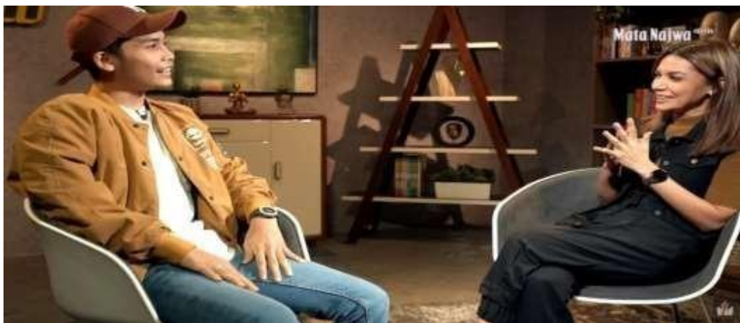
Gambar 1.2 Video Antara Najwa Shihab Dan Bintang Emon Di Media Sosial Youtube ( https://www.youtube.com/watch?v=rgP7lpn7M_E ).

negara Indonesia yang lebih baik. Jurnalis terkenal Najwa Shihab yang terkenal sangat kritis terhadap Pemerintah pernah mengundang Bintang Emon di acara yang dinamakan dengan Narasi. Diundanginya Bintang Emon pada acara tersebut telah menunjukkan bahwa Bintang Emon adalah Stand up Comedian yang memiliki pengaruh yang besar bagi para Netizen di dunia maya di Indonesia. Pada video di Youtube Najwa Shihab yang diberi judul, Bintang Emon Soal Perebutan Kekuasaan di Atas, Bodo Amat telah ditonton sebanyak 721.304 orang dan mendapatkan komentar sebanyak 578 Komentar. Video antara Najwa Shihab dengan Bintang Emon dapat dilihat pada link berikut: https://www.youtube.com/watch?v=rgP7lpn7M_E . Salah satu pembahasan yaitu mengapa Bintang Emon menggunakan media sosial seperti Tiktok untuk menyampaikan kritik terhadap Pemerintah adalah media sosial Tiktok dianggap lebih praktis, penyebaran bisa massif, dan menjangkau semua kalangan. Walaupun, penyebaran media sosial melalui Tiktok juga memiliki konsekuensi karena video tersebut bisa saja terkena UU ITE, serta dampak keamanan bagi Bintang Emon sendiri dan orang-orang terdekatnya. Gambar video antara Najwa Shihab dan Bintang Emon di media sosial Youtube dapat dilihat dibawah ini.