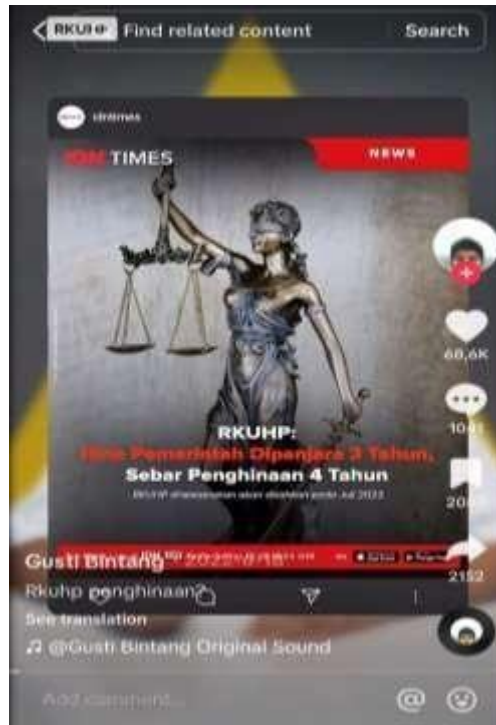
Gambar 1.4 Video Antara Najwa Shihab Dan Bintang Emon Di Media Sosial Tiktok ( https://vt.tiktok.com/ZSLLBeqen/?t=1 )

Berdasarkan latar belakang tersebut, maka penelitian berfokus pada penggunaan gaya bahasa satire Bintang Emon dalam video kritiknya tentang hasil keputusan sidang atas disahkannya RKUHP.