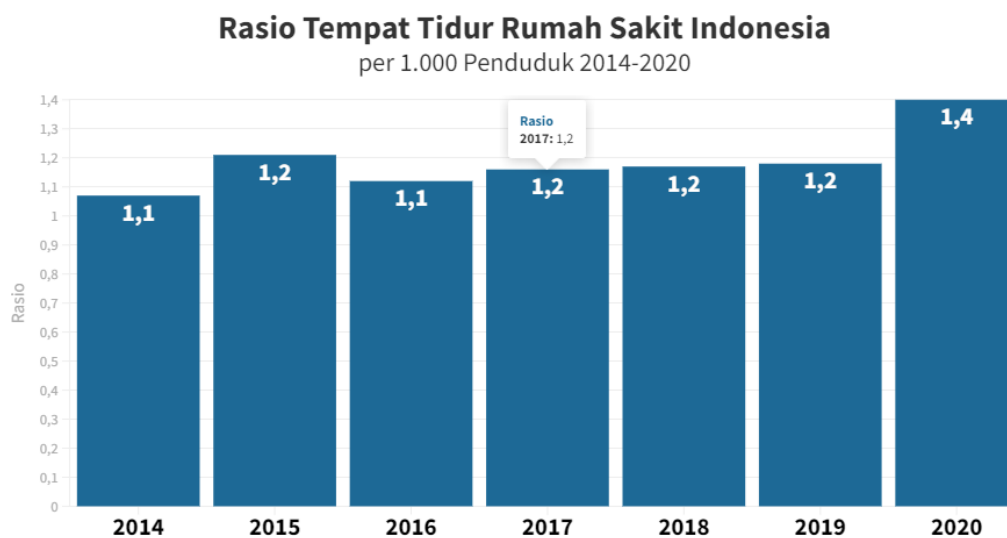
Gambar 1. 1 Rasio Tempat Tidur Rumah Sakit Indonesia