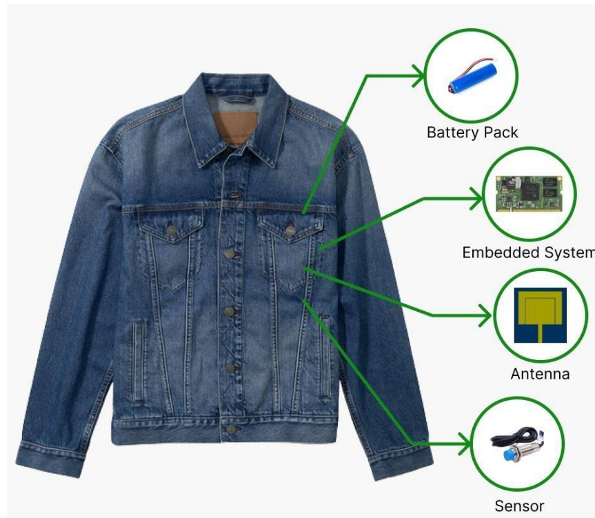
Gambar 1. 1 Sistem Monitoring Kesehatan Wearable