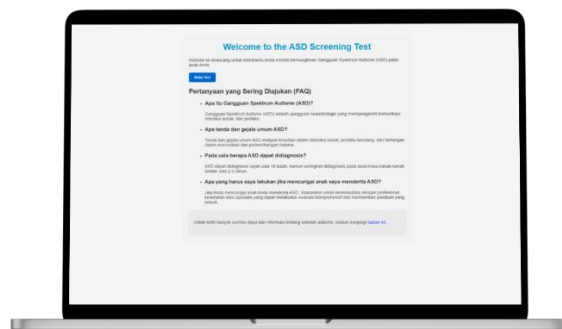
Gambar 3. Home Screen