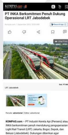
Gambar 4 .1 Artikel Berita yang membuat release PT INKA (Persero)