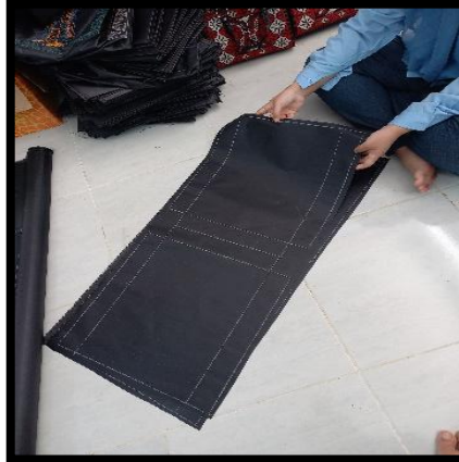
Gambar 4. Material Produk Kerajinan Motif Hias Aceh

Perbedaan kebutuhan dan gaya hidup modern yang mengutamakan fungsionalitas dan kepraktisan seperti dengan adanya kompartemen yang lebih banyak, fitur tahan air hingga fitur anti maling pada desain tas modern belum dapat ditemukan pada tas tangan dari Aceh yang diproduksi Nani Souvenir. Oleh karena itu, dalam upaya mempertahankan ciri khas yang dimiliki kerajinan Aceh namun tetap relevan dengan inovasi tren yang berkembang, maka diperlukan aplikasi metode yang dapat digunakan untuk mengembangkan produk kerajinan tersebut dengan cara yang lebih modern sembari mempertahankan unsur-unsur yang menjadi karakter dalam budaya Aceh. Tujuan dari penelitian ini adalah: