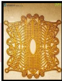
Gambar 1. Pinto Aceh

Dengan banyaknya variasi motif kerajinan bordir Aceh, disini penulis hanya memilih satu buah motif yaitu motif Pinto Aceh untuk produk berupa tas tangan. Pinto Aceh terinspirasi dari bangunan peninggalan dari bangunan-bangunan kerjaan Sultan Iskandar Muda yaitu Pinto Khop (Karya Mansyah, 2020:38).