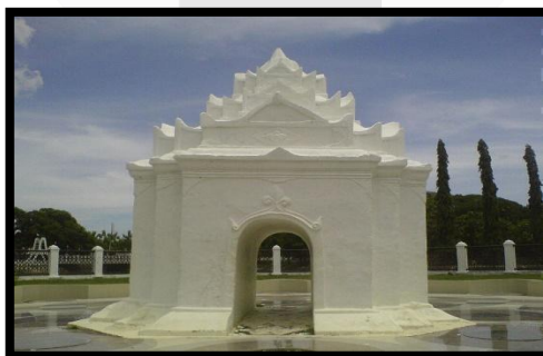
Gambar 2. Pinto Khop