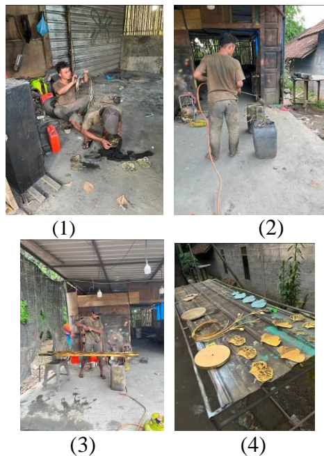
Gambar 5. Proses Finishing