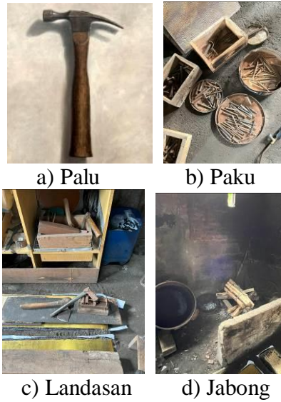
Gambar 4. Alat Proses Pengukiran