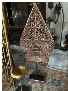
Gambar 10. Gunung Wayang