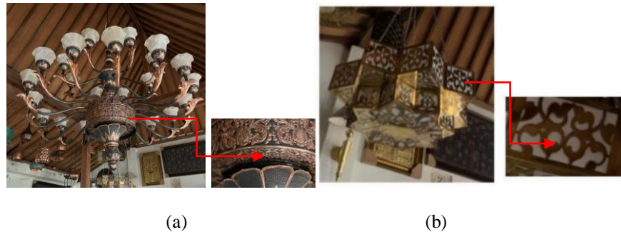
Gambar 9. Lampu Hias

Lampu hias pada gambar “a” menggunakan material tembaga dengan ornamen batik meru yang merepresentasikan Gunung Mahameru serta orname lidah api yang mengelilingi sekitarnya dibagian tepi yang merepresentasikan nyala api atau agni. Pada gambar “b” menggunakan material kuningan dengan ornamen batik tumbuhan menjalar dan lunglungan atau melengkung-lengkung.