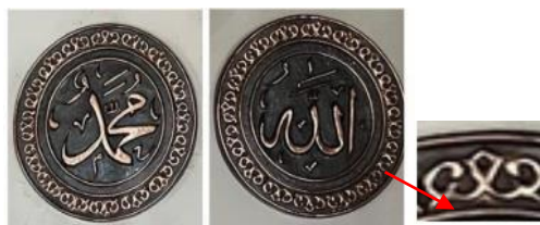
Gambar 7. Kaligrafi