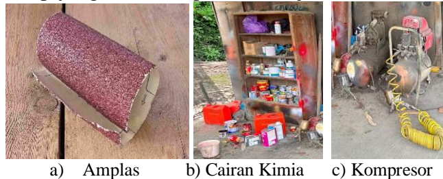
Gambar 6. Alat Proses Finishing

Pada proses pencetakan dan ukiran menggunakan teknik dekoratif untuk menghasilkan tekstur pada permukaan logam, maka diperlukan pola rancangan saat menekan tekstur pada permukaan logam melalui stamping dengan menggunakan karakteristik cetakan logam.