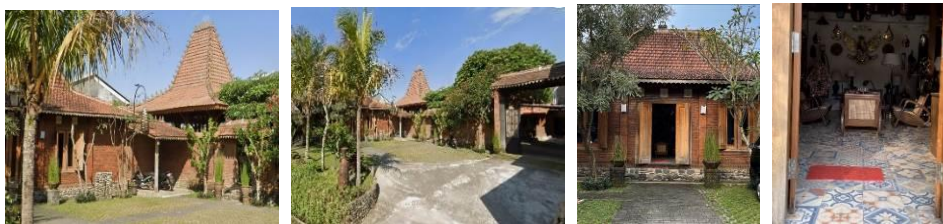
Gambar 12 . Galeri Talijiwo Art Tampak Luar

Galeri seni Talijiwo Art memiliki konsep bangunan dengan gaya arsitektur rumah tradisional khas Jawa Tengah yaitu rumah joglo dengan atap yang melengkung disetiap sisi dan menjulang tinggi. Dinding-dinding nya menggunakan batu bata merah dengan ukuran pintu yang besar menciptakan kekhasan dan kesan klasik dari konsep bangunan dengan gaya tradisional Jawa. Lantainya pun menggunakan motif geometris dan floral dengan material keramik yang mencerminkan elemen tradisional pada seni rupa Jawa. Dekorasi pada ruangan galeri merupakan perpaduan gaya modern namun terdapat sentuhan tradisional. Meja dan kursi yang khas menggunakan material kayu dengan ukiran yang halus menjadi elemen tambahan dari galeri seni kerajinan tembaga dan kuningan yang menciptakan suasana nyaman dan hangat bagi para pengunjung. Galeri Talijiwo Art juga memiliki halaman terbuka atau area luar ruangan yang terlindungi atap Joglo untuk tempat bersantai bagi para pengujung yang datang ke galeri. Selain memanfaatkan kosep rumah Joglo, halaman yang luas dengan konsep terbuka ini dimanfaatkan sebagai sarana untuk membuat gallery café, dimana selain bertujuan untuk membeli produk pengunjung juga bisa bersantai sambil menikmati hidangan yang disajikan dan menikmati lingkungan galeri. Seluruh elemen bangunan pada galeri