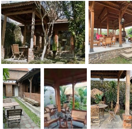
Gambar 13 . Galeri Talijiwo Art Tampak Dalam