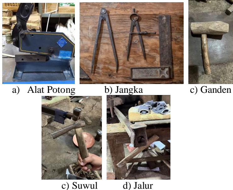
Gambar 2. Alat Proses Pembentukan

Beberapa alat produksi pembentuk seperti alat potong untuk memotong lembaran plat tembaga, ganden yaitu alat pukul logam untuk membuat bentuk, suwul palu besi untuk menciptakan tekstur pada logam dan jalur sebagai landasan saat proses pembentukan produk.