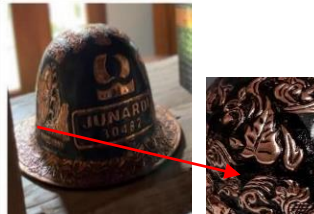
Gambar 11. Topi Ukir Tembaga

Motif ukiran flora khas Boyolali, topi ukir tembaga yang menjadi koleksi bagi segelintir orang seperti beberapa nama atau logo perusahaan yang diukir dalam topi, ukiran motif flora dan fauna maupun motif relung yang memiliki ciri khas.