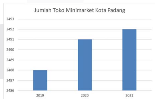
Gambar I. 3 Data Jumlah Minimarket Di Kota Padang

Berdasarkan data di atas dapat dilihat melalui grafik hasil penjualan dari aura mart pada tahun 2022, dimana penjualan aura mart belum pernah mencapai target penjualan. Target penjualan aura mart sendiri di targetkan mencapai Rp. 30.000.000 per bulannya.