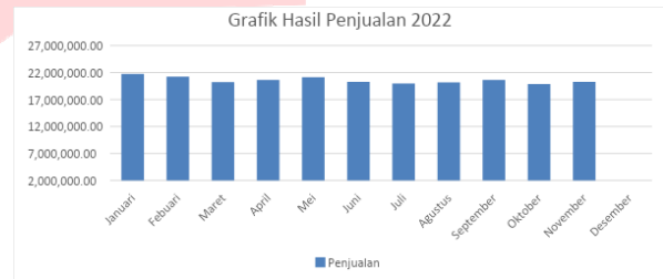
Gambar I. 2 Data Penjualan Aura Mart

besar ini yang belum ada di Kota Padang menciptakan peluang besar bagi warga setempat untuk memulai bisnis ritel mereka sendiri. Akibatnya, di berbagai lokasi di Kota Padang, terdapat minimarket dan swalayan dengan merek lokal yang beroperasi.