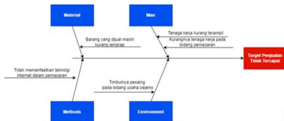
Gambar I. 4 Fishbone

teknologi internet untuk mempromosikan produk. Oleh karena itu strategi pemasaran untuk Aura Mart sangat penting karena tingginya tingkat persaingan dengan pesaing yang serupa dengan Aura Mart. Untuk dapat bersaing dengan pesaing lain, diperlukan strategi-strategi yang tepat. Akibat persaingan yang tinggi dan strategi yang tidak tepat mengakibatkan target penjualan dari Aura Mart tidak tercapai.