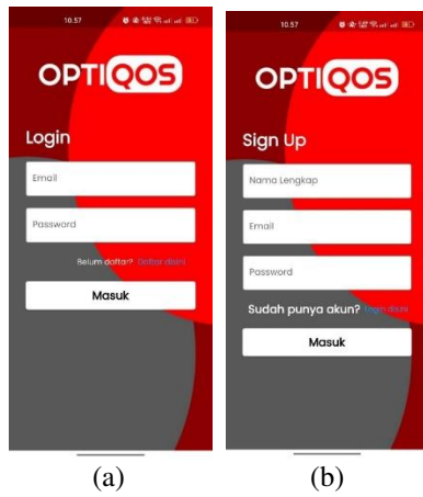
(a) (b) GAMBAR 2 (a) tampilan login (b) tampilan register

Secara khusus, bagian implementasi aplikasi melibatkan sub-sistem Mobile Application yang memberikan pengguna pengalaman login yang mudah dan pilihan untuk mendaftar sebagai pengguna biasa atau sebagai administrator yang tertera pada gambar . Pengguna, terutama teknisi, dapat mengakses dan memanfaatkan aplikasi dengan cepat, meningkatkan keterjangkauan dan responsibilitas pengguna di lapangan. Dengan fokus pada mobilitas, aplikasi ini diharapkan memberikan manfaat konkret dalam meningkatkan produktivitas dan efisiensi pekerjaan teknisi.