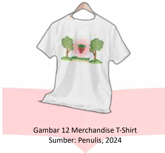
Gambar 12 Merchandise T-Shirt

Kaos yang berisi ilustrasi gambar kebun stroberi dan menampilkan jenis buah stroberi yaitu mencir dan kalibrite (Menbrite)