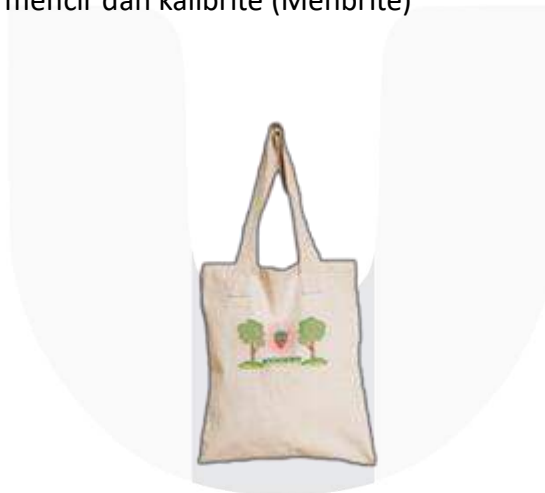
Gambar 13 Merchandise Tote Bag

Merchandise ini akan menjadi iklan yang berjalan sehingga memunculkan awareness di masyarakat akan adanya kebun stroberi Lebakmuncang secara hardsell.