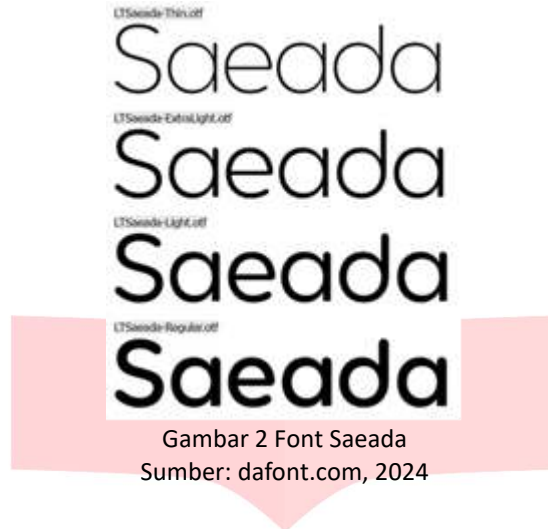
Gambar 2 Font Saeada

Font ini akan menjadi aset teks judul atau teks pendukung lainnya yang memiliki karakter santai kasual dengan bentuk font yang membulat.