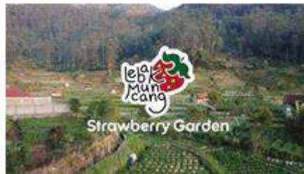
Gambar 5 TVC Teaser

Teaser ini ditunjukkan sebagai media attention untuk menarik perhatian dan menambah awareness kebun stroberi Lebakmuncang. Video teaser ini akan di tampilkan di ruang publik seperti mall dan terminal. Teaser TVC ini akan menampilkan informasi sekilas tentang kebun stroberi Desa Lebakmuncang. Video ini dirancang hanya menampilkan cuplikan adegan saja agar membuat penasaran dan bisa menarik perhatian audiens untuk menonton video lengkapnya.