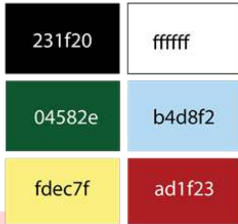
Gambar 4 Palet warna