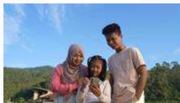
Gambar 11 TVC

Flyer akan dibagikan untuk memberikan informasi terkait peluncuran TVC. Flyer ini akan dibagikan di ruang publik seperti terminal atau kafetaria. Flyer ini sebagian bisa digunakan sebagai voucher diskon tiket yang nantinya bisa ditukarkan untuk membeli tiket masuk .