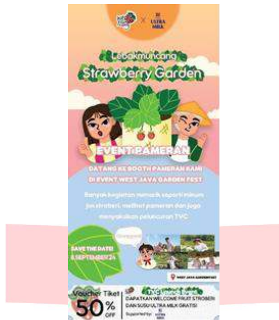
Gambar 10 Flyer