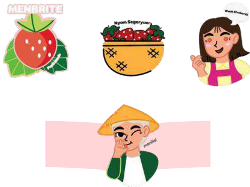
Gambar 14 Merchandise Stiker

Stiker akan menjadi tambahan merchandise menjadi media promosi yang dibawa masyarakat di berbagai tempat.