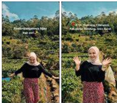
Gambar 7 Instagram reels

Desain Poster di atas memberikan informasi adanya peluncuran video lengkap dari teaser TVC untuk audiens ikuti agar bisa menonton video lengkapnya. Menampilkan warna merah muda gelap yang seolah-olah sesuatu yang masih ditutupi dan sorotan cahaya menunjukkan informasi penting ditengahnya yaitu peluncuran TVC. Poster di atas akan ditempatkan di ruang publik.