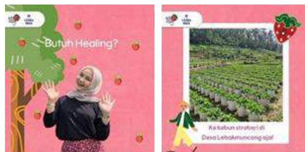
Gambar 9 Poster Digital Instagram

Tripod banner pada tahapan interest menggiring audiens untuk datang ke pameran West Java Garden Fest di acara peluncuran TVC kebun stroberi Desa Lebakmuncang. Desain dibuat menampilkan foto suasana kegiatan di kebun dan didukung ilustrasi yang menarik.