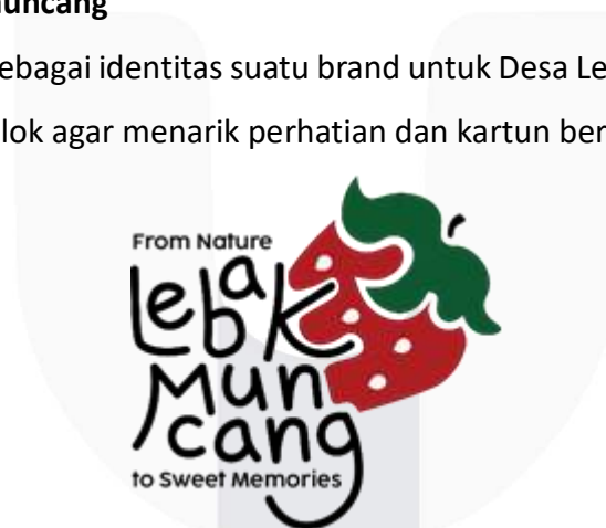
Gambar 1 Logo Desa Lebakmuncang

Aset Logo sebagai identitas suatu brand untuk Desa Lebakmuncang. Warna yang dipilih mencolok agar menarik perhatian dan kartun bertema buah stroberi.