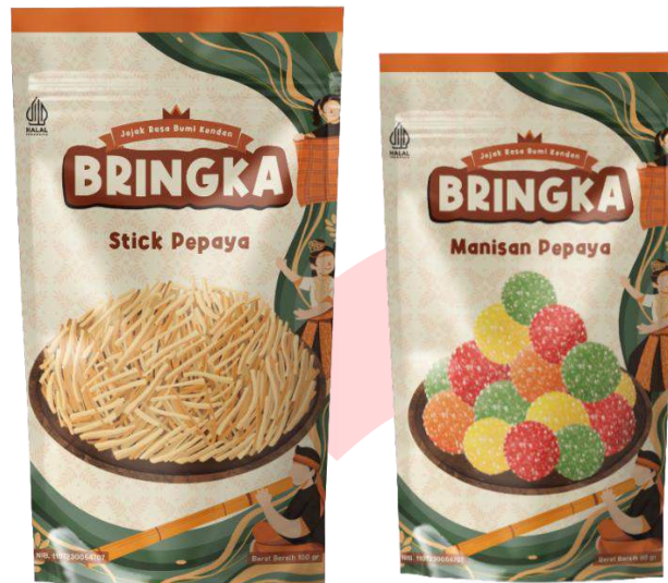
Gambar 11. Mockup kemasan Bringka

Pada perancangan kemasan camilan pepaya Bringka menggunakan standing pouch dengan ukuran 12 cm x 20 cm untuk stick pepaya, dan ukuran 10 cm x 16,5 cm untuk manisan pepaya.