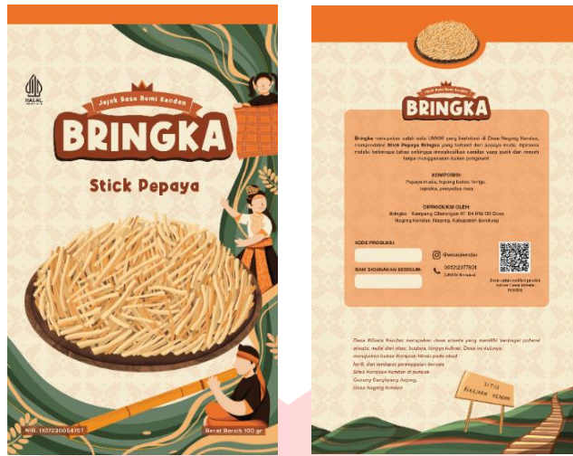
Gambar 6. Label kemasan stick pepaya Bringka