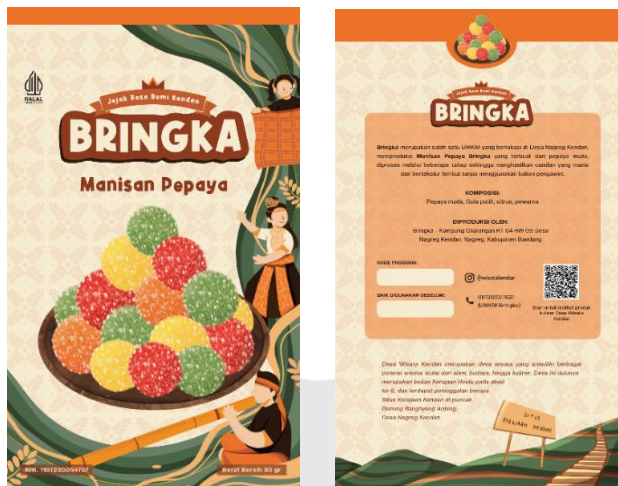
Gambar 7. Label kemasan manisan pepaya Bringka