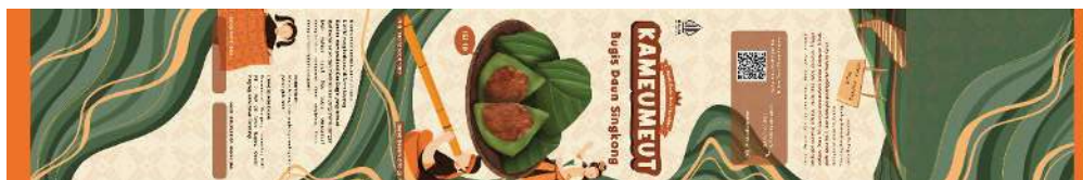
Gambar 8. Label kemasan bugis daun singkong Kameumeut Sumber: Dokumentasi penulis, 2024