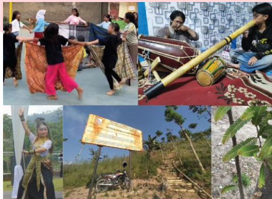
Gambar 1. Unsur wisata budaya dan alam Desa Wisata Kendan

Dalam perancangan kemasan ini menggunakan ilustrasi makanan setiap produk UMKM kuliner Desa Nagreg Kendan, serta ilustrasi suasana dan wisata di Desa Nagreg Kendan. Beberapa unsur wisata budaya dan alam pada Desa Nagreg Kendan yang akan dijadikan sebagai aset visual pada perancangan adalah kaulinan berudak, tari jaipong, alat musik tradisional gong sebul, situs kerajaan Kendan, serta aset visual pendukung berupa daun malaka. Penerapan ilustrasi pada kemasan produk berperan sebagai pendukung estetik, memberikan nilai lebih untuk mempengaruhi minat konsumen dalam membeli sebuah produk (Lestari dkk, 2022).