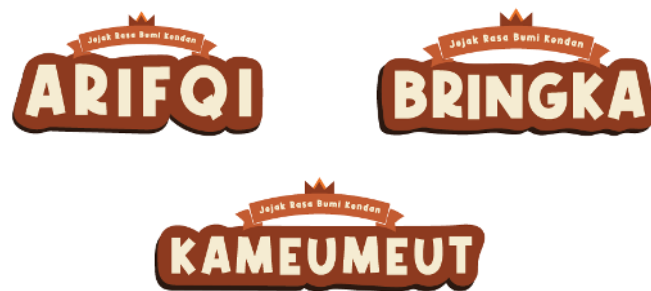
Gambar 4. Logotype dan Tagline UMKM Kuliner Desa Nagreg Kendan

Logo yang digunakan pada perancangan kemasan ini menggunakan jenis logotype bertuliskan nama setiap UMKM kuliner yang ada di Desa Nagreg Kendan. Penggunaan huruf katipal dan outline coklat yang tebal bertujuan agar logotype menonjol dan mudah terbaca. Di atas logotype terdapat tulisan tagline “Jejak Rasa Bumi Kendan”. ‘Jejak Rasa’ merujuk pada pengalaman para wisatawan dalam menemukan dan menikmati berbagai kuliner yang ada di Desa Nagreg Kendan. Sedangkan ‘Bumi Kendan’ merujuk pada Desa Nagreg Kendan itu sendiri.