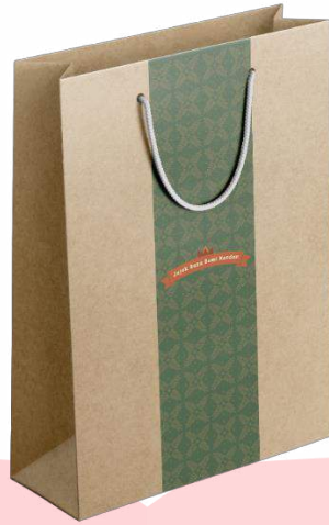
Gambar 17. Paperbag