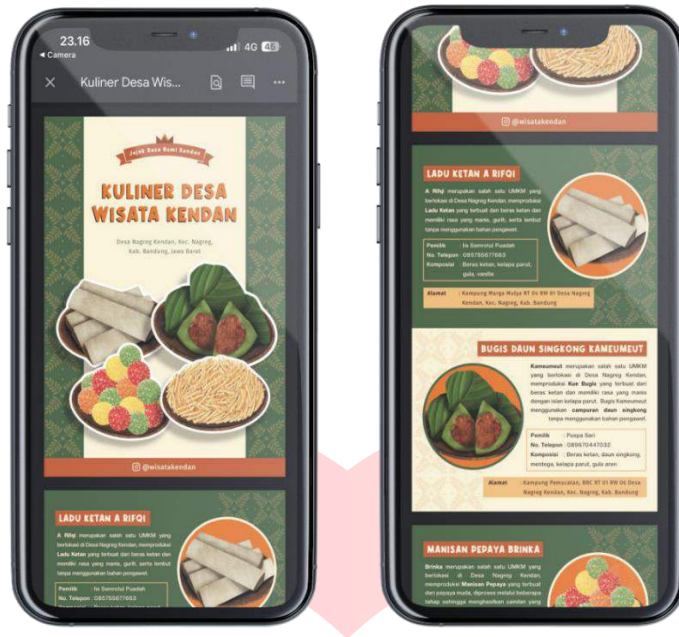
Gambar 15. E-Book dan QR Code