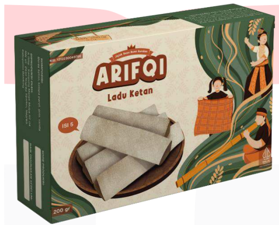
Gambar 9. Mockup kemasan ladu ketan A Rifqi

Pada perancangan kemasan ladu ketan A Rifqi menggunakan box dengan ukuran panjang 15 cm, lebar 9 cm, dan tinggi 3 cm menyesuaikan ukuran dan jumlah dari produk. Material box yang digunakan adalah kertas ivory sekitar 300 gsm dengan laminasi glossy di bagian luas kemasan. Material kemasan berbahan karton cukup populer karena terdapat banyak macam material karton, jenis cetakan, bentuk, ukuran, dan tidak terlalu membutuhkan investasi yang besar (Julianti, 2014:60).