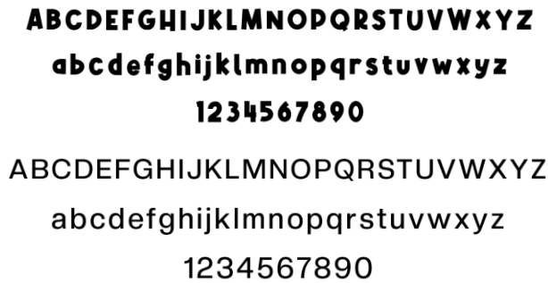
Gambar 2. Font Alphakind dan Creado Display

Warna yang akan digunakan pada perancangan desain kemasan ini terdiri dari beberapa warna yang didapatkan dari hasil observasi di Desa Nagreg Kendan, sehingga dapat menjadi ciri khas dan mencerminkan desa itu sendiri. Menurut Nugroho (dalam Dewi, Hairiza, & Limbong, 2019), setiap warna memberi kesan serta identitas tertentu, sehingga warna dapat menjadi identitas suatu produk.