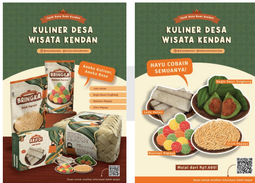
Gambar 14. Flyer