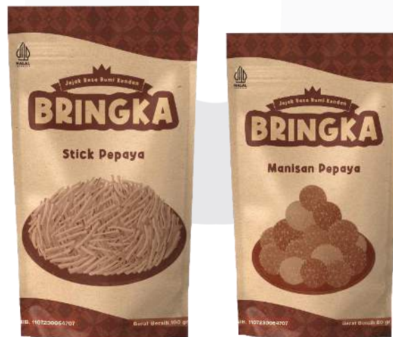
Gambar 12. Mockup kemasan variasi Bringka