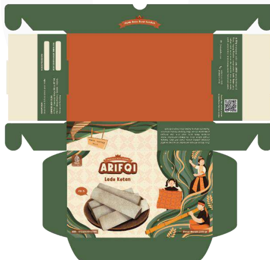
Gambar 5. Kerangka kemasan ladu ketan A Rifqi