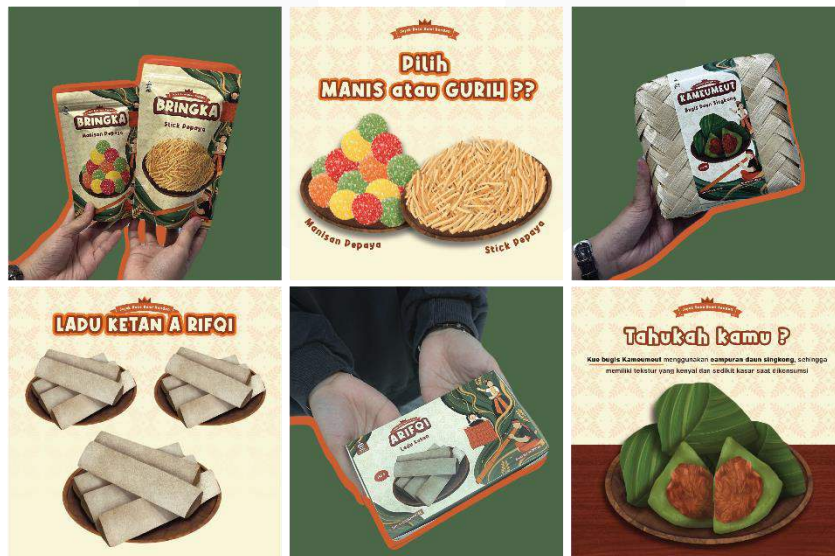
Gambar 16. Postingan sosial media