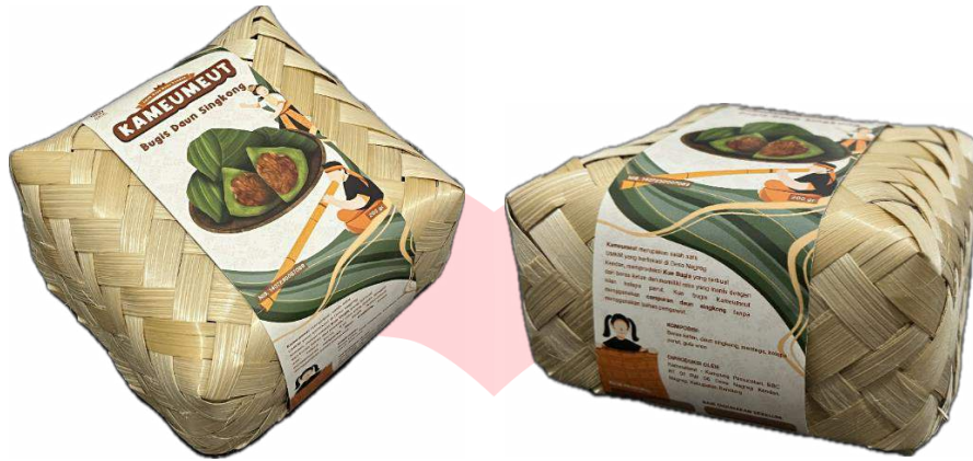
Gambar 13. Mockup kemasan bugis daun singkong Kameumeut

Produk bugis daun singkong akan menggunakan kemasan besek yang sudah dipakai oleh UMKM Kameumeut, sehingga untuk perancangannya berfokus pada label kemasaannya dengan ukuran 43 cm x 7 cm mengelilingi kemasan, serta menggunakan material kertas art paper sekitar 150 gsm.