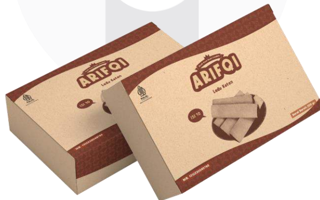
Gambar 10. Mockup kemasan variasi ladu ketan A Rifqi