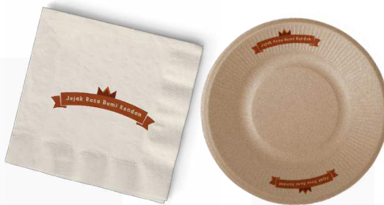
Gambar 18. Tisu