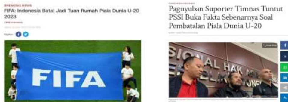
Gambar 1. 2 Berita yang diterbitkan oleh cnnindonesia.com dan tribunnews.com

cnnindonesia.com. Pemilihan kedua portal berita online karena kedua portal berita tersebut menayangkan pemberitaan tentang ketidak berhasilan Indonesia sebagai tuan rumah Piala Dunia pada rentang waktu 14 Maret hingga 10 April 2023. Melalui situs resmi kedua portal berita tersebut, tribunnews.com menerbitkan 26 berita dan cnnindonesia.com menerbitkan sebanyak 140 berita tentang kegagalan Indonesia menjadi tuan rumah. Selain itu, penulis menentukan kedua portal berita online berdasarkan dari Reuters Institute dalam laporannya Digital News Report Indonesia 2023 , dimana cnnindonesia.com dan tribunnews.com merupakan 9 top portal berita online yang paling kredibel serta masyarakat Indonesia yakini bahwa beritanya paling terpercaya, dimana cnnindonesia.com memiliki presentase sebesar 68% dan tribunnews.com 55% (reutersinstitute.politics.ox.ac.uk, 2023). Dari total 166 berita dari kedua portal berita online tersebut, penulis menentukan 6 berita yang merujuk pada kinerja serta keterlibatan PSSI dalam kejadian kegagalan tersebut. Berikut merupakan contoh berita yang diterbitkan oleh kedua portal berita tersebut: