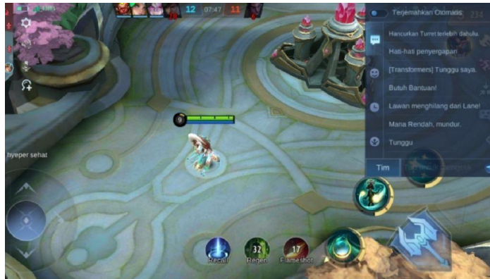
Gambar 1.1 Fitur chat pada game online Mobile Legend

seperti yang ditunjukkan pada gambar 1.1.