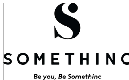
Gambar 01.1 Logo Brand Somethinc

Logo Somethinc tampil dengan huruf S yang diikuti dengan kata Somethinc beserta filosofinya yaitu Be you, Be somethinc yang berwarna hitam dengan latar belakang berwarna putih. Nama Somethinc sendiri diambil dari satu masalah dimana Somethinc ingin memberikan sesuatu kepada konsumen sesuai dengan jenis masalah kulitnya, atau yang berarti “So, we will always have Somethinc from you”. Hal ini merupakan sebuah harapan agar Somethinc dapat berkembang menjadi besar dengan selalu dapat memenuhi tantangan akan kebutuhan kulit konsumen. Berikut adalah logo brand Somethinc :