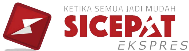
Gambar 1. 3 Logo SiCepat Ekspres

Sicepat Ekspres, sebuah perusahaan logistik nasional di Indonesia, telah membangun citra dan reputasi positif dengan berbagai melakukan kontribusi kegiatan dan strategi. Perusahaan ini memanfaatkan media sosial untuk meningkatkan kepercayaan pelanggan dan menciptakan reputasi yang baik. Berdasarkan artikel berita pada laman resmi SiCepat (2021), penghargaan Top Digital Public Relations Award yang diselenggarakan oleh Tras N CO dan Infobrand.id, diberikan kepada Sicepat Ekspres. Citra perusahaan juga terealisasi pada logo berikut dengan menampilkan kunci kemudahan pelayanan.