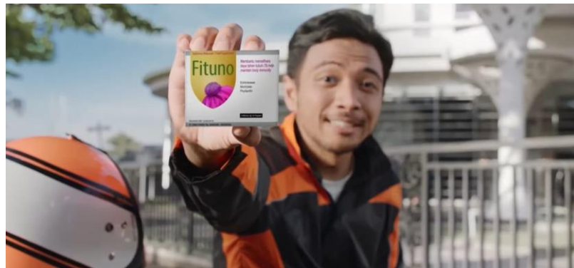
Gambar 1. 3 Iklan Humor Fituno di Youtube

Sedangkan, Iklan Fituno yang berjudul “#HarusFit, Minum Fituno” yang berdurasi empat puluh enam detik ini mendapat 109 ribu kali penonton, yang bercerita tentang seorang pengantar profesional atau ojek online yang setiap hari bekerja membawa penumpang dalam segala kondisi cuaca. Sebagai ojek online tentu harus memiliki kondisi yang kuat dan sehat setiap hari. Selain itu, dalam iklan tersebut terdapat penjelasan manfaat dan penggunaan dari Fituno terhadap tubuh. Selain itu, terdapat hashtag yang menjadi tagline Fituno yaitu #HarusFit, Minum Fituno!.