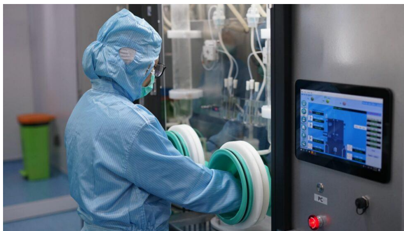
Gambar I.1 PT XYZ Surabaya melakukan analisis Bacterial Filtration Efficiency (BFE) masker medis dengan menggunakan BFE tester

pola pengelolaan proses produksi yang baik. Berbagai terobosan untuk meningkatkan kompetensinya dengan memperluas ruang lingkup akreditasi terus dilakukan. Selain berfokus pada analisa di bidang keamanan pangan, PT XYZ Surabaya juga melayani analisa di bidang kosmetik, farmasi, perikanan, mainan, tekstil, otomotif, hingga kelistrikan. Untuk mengembangkan layanannya, PT XYZ sepenuhnya menggunakan mesin dan teknologi terbaik seperti Real Time PCR, HPLC, UPLC, GC, HS-GC, AAS, ICP-OES, ICP MS, LC-ICP-MS, GCMS, GCMSMS, LCMS, LCMSMS, bahkan LCMSMS Qtof.