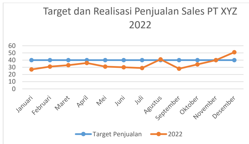
Gambar I.3 Diagram Jumlah Target dan Realisasi Penjualan PT XYZ tahun 2022