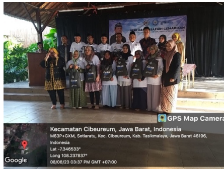
Gambar 1. 2 Kampanye Gemarikan Secara Langsung