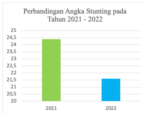
Gambar 1. 1 Perbandingan Angka Stunting Tahun 2021-2022

Dapat dilihat pada gambar 1.1 di atas bahwa persentase angka stunting di Indonesia pada tahun 2021 sebesar 24,4%. Sedangkan pada tahun 2022 persentase angka stunting sebesar 21,6%. Hal ini menunjukkan sudah terjadi penurunan persentase balita stunting di Indonesia. Tetapi menurut Kementerian Kesehatan Republik Indonesia, angka tersebut masih belum mencapai target untuk pengurangan angka stunting di Indonesia pada tahun 2024 sebesar 14% [7].