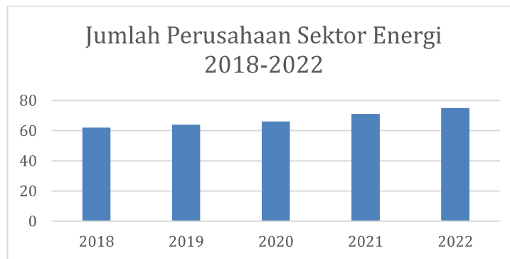
Gambar 1.1 Jumlah Perusahaan Sektor Energi Tahun 2018-2021

Sektor energi mencakup perusahaan-perusahaan yang terlibat dalam eksplorasi dan pengembangan cadangan minyak atau gas, pengeboran minyak dan gas, dan pemurnian. Produk yang dihasilkan oleh sektor energi di antaranya batu bara, minyak bumi dan gas alam. Perusahaan energi yang bergerak dalam bidang produksi minyak dan gas bumi akan menghasilkan produk minyak mentah, gas alam, dan produk turunan minyak seperti bensin, solar, dan LPG. Jumlah perusahaan sektor energi dan terdaftar di BEI terus bertambah setiap tahunnya, dapat dilihat pada Gambar 1.1 berikut.