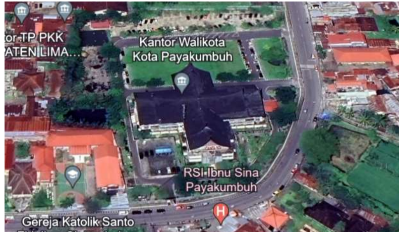
Gambar 1.1 Lokasi Objek Desain (sumber : google earth)

Lokasi Mal Pelayanan Publik Kota Payakumbuh sangat baik untuk sebuah pusat pelayanan publik karena berada di pusat Kota Payakumbuh. Lokasi ini dengan mudah dijangkau oleh masyarakat, karena dapat diakses dengan transportasi umum dan transportasi pribadi. Pada lokasi ini juga terdapat beberapa fasilitas umum seperti Rumah Sakit Islam Ibnu Sina, Kantor Pegadaian, Yayasan Pendidikan Katolik dan Gereja Katolik. Hal ini membuktikan bahwa lokasi ini strategis, cukup ramai dan mudah diakses.