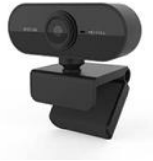
GAMBAR 2. 3 Webcam

Webcam adalah kamera bisa dilihat secara realtime dan gambarnya bisa dilihat melalui www (World Wide Web) , program pengolah pesan cepat. Webcam dapat diartikan juga sebagai sebuah kamera video digital kecil yang dihubungkan ke komputer melalui port USB, port COM atau dengan jaringan Ethernet atau Wi-Fi[10].