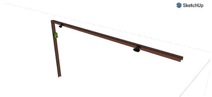
GAMBAR 3. 1 Desain alat keseluruhan

Desain 3D dibuat untuk mendesain bentuk alat yang sudah dikonsepskan sebelumnya. Bentuk alat bersifat portable dan tidak mengganggu kenyamanan pengguna. Desain 3D alat ini menggunakan software sketchup. Pada design keluruhan alat terdapat komponen webcam dan raspberry Pi 4B.