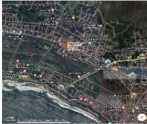
Gambar 1.5.1 Lokasi area site plan