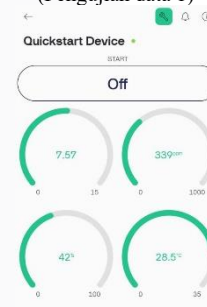
GAMBAR 3. (Pengujian data 2)