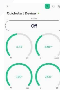
GAMBAR 4. (Pengujian data 3)