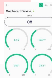
GAMBAR 2. (Pengujian data 1)