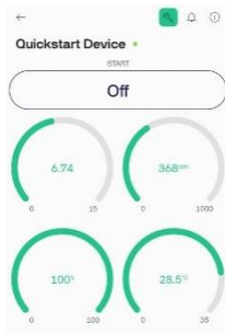
GAMBAR 4. (Penguujian data 3)