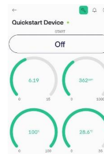
GAMBAR 2. (Pengujian data 1)