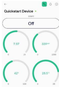
GAMBAR 3. (Penguujian data 2)