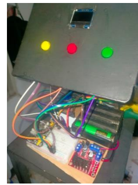
Gambar 2 electrical box pada alat injection molding

Perancangan sistem ini mengandalkan ESP32 sebagai unit control. ESP32 mengandalkan termokopel tipe-K sebagai sensor suhu dengan modul Max 6675 untuk mengubah tegangan listrik dari termokopel menjadi nilai digital untuk diproses oleh ESP32. Untuk menunjukkan informasi data suhu, kondisi dan setpoint, digunakan OLED 0.96 inch sebagai display tertanam pada alat injection molding . Dilengkapi juga push button untuk merubah setpoint