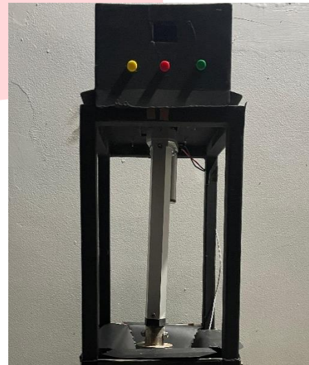
GAMBAR 3 aktuator pendorong

Temperature controller juga akan terhubung pada motor driver L298N untuk mengendalikan aktuator.