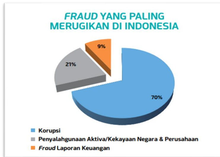
Gambar 1.3 Fraud Paling Merugikan di Indonesia

penyalahgunaan aktiva/kekayaan Negara & perusahaan dengan persentase 28,9% atau dipilih oleh 69 responden, dan yang terakhir fraud laporan keuangan sebesar 6,7% atau dipilih oleh 16 responden. Pengungkapan kasus kecurangan tersebut paling banyak menggunakan media berupa laporan keuangan sebagai pengungkap kecurangan di Indonesia ( Association of Certified Fraud Examiners Indonesia , 2019).