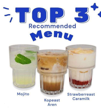
Gambar 1.2 Produk Easturn Coffee

Easturn Coffee menjual produk coffee dan non coffee. Menu coffee sendiri memiliki 15 varian rasa yang beragam, antara lain seperti Seasalt Caramel, Es Kopi susu pandan dan flat white. Di samping itu, menu non coffee tidak kalah beragam karena memiliki 17 varian yakni cookie monster, strawberry tonic dan masih banyak lagi. Produk-produk tersebut dikenakan harga mulai dari 18.000 Rupiah hingga 36.000 Rupiah. Menu makanan juga disediakan dengan berbagai pilihan.