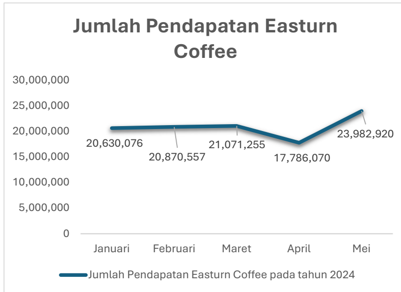
Gambar 1.7 Pendapatan Easturn Coffee