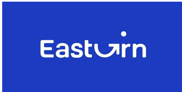
Gambar 1.1 Logo Easturn Coffee

Easturn Coffee adalah kafe yang menyediakan tempat yang nyaman untuk menikmati makanan dan minuman. Easturn Coffee terletak di Jalan Cilangkap Baru No.1 Blok B, RT.3/RW.1, Cilangkap, Kec. Cipayung, Kota Jakarta Timur, Daerah Khusus Ibukota Jakarta. Kafe ini menyediakan berbagai pilihan makanan dan minuman menarik, pilihan varian kopi yang beragam ditawarkan agar konsumen bisa menikmati cita rasa biji kopi yang berkualitas. Menu non kopi, makanan ringan, hingga makanan berat juga dijual agar konsumen semakin nyaman berada di kafe ini. Atmosfer hangat juga ditawarkan Easturn Coffee dalam memberikan suasana yang nyaman kepada konsumen. Fasilitas Wifi dan stopkontak tersebar di seluruh bagian kafe membuat Easturn Coffee menjadi tempat yang nyaman untuk bekerja, belajar maupun berkumpul.