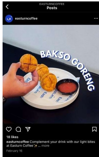
Gambar 1.6 Foto produk