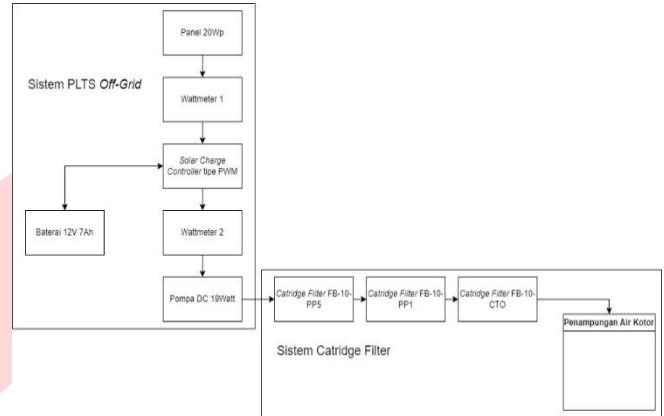
Gambar 3. 1 Alur Kerja Sistem

Sistem akan dijalankan dengan metode menyalakan pompa setelah pengisian baterai. Saat sistem dijalankan baterai dalam kondisi kosong. Pada sistem ini terdapat tiga tahap pengisian dan penggunaan baterai dalam satu hari.