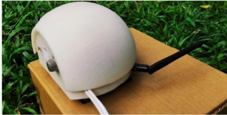
Gambar 1. 1 Sensor Pendeteksi Kebakaran Hutan

Penggunaan sensor bisa dimanfaatkan untuk melakukan monitoring terhadap kondisi hutan. Salah satu metodenya adalah Wireless Sensor Network (WSN), WSN banyak digunakan untuk pengawasan lingkungan terutama untuk bencana alam, seperti kebakaran hutan. WSN ini bekerja dengan cara menyebarkan alat sensor di area luas, seperti hutan dan lahan [11].