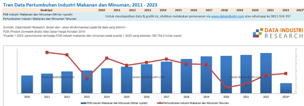
Gambar 1. 2 Pertumbuhan Industri Makanan Dan Minuman dari Produk Domestik Nasional

Berikut ini adalah Tren Data Pertumbuhan Industri Makanan dan Minuman dari Produk Domestik Nasional :