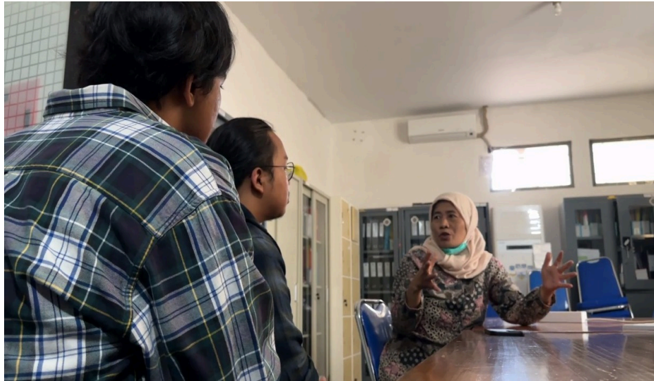
Gambar 1.2 Puskesmas Bojongsoang