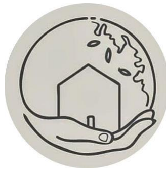
Gambar 1. 1 Logo Cafe Taman Utara

Berikut adalah Logo dan Makna Logo yang dimiliki oleh cafe Taman Utara: