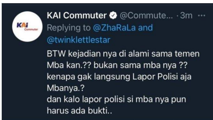
Gambar 1 Balasan Komentar Agent Media Sosial X PT.KAI

Pelecehan seksual yang dialami oleh customer PT. Kereta Api Indonesia terjadi pada 6 Juni tahun 2021 dan diunggah pada akun media sosial X @ZhaRaLa. Salah satu akun twitter @ZhaRaLa mengadukan dugaan pelecehan seksual yang telah menimpa temannya ke akun twitter @CommuterLine. Dari adanya kasus ini tentunya admin dari layanan Contact Center 121 langsung menanggapi hal tersebut namun, tanggapan yang diberikan oleh admin layanan Contact Center 121 dianggap mengecewakan. Penangan kasus pelecehan seksual dinilai tidak tepat dalam menangani kasus tersebut dikarenakan kesalahan agent sosial media dalam merespon korban pelecehan seksual melalui X. Pengaduan yang telah dilayangkan tidak mendapati penanganan yang baik melainkan mendapatkan balasan yang tidak menyenangkan. Sehingga hal ini berdampak pada citra PT. Kereta Api Indonesia yang menghasilkan pandangan negatif bagi pengguna kereta api Indonesia.