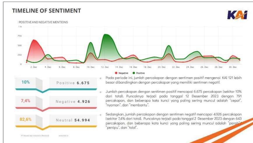
Gambar 1 Grafik Sentiment KAI121 Tahun 2023

Dari hasil analisis data yang dilakukan melalui media X @KAI121 pada tahun 2023 memperlihatkan bahwa terdapat kenaikan sentiment positif mengenai KAI 121 dibandingkan dengan percakapan sentiment negatif yang menghasilkan 4.926 percakapan.