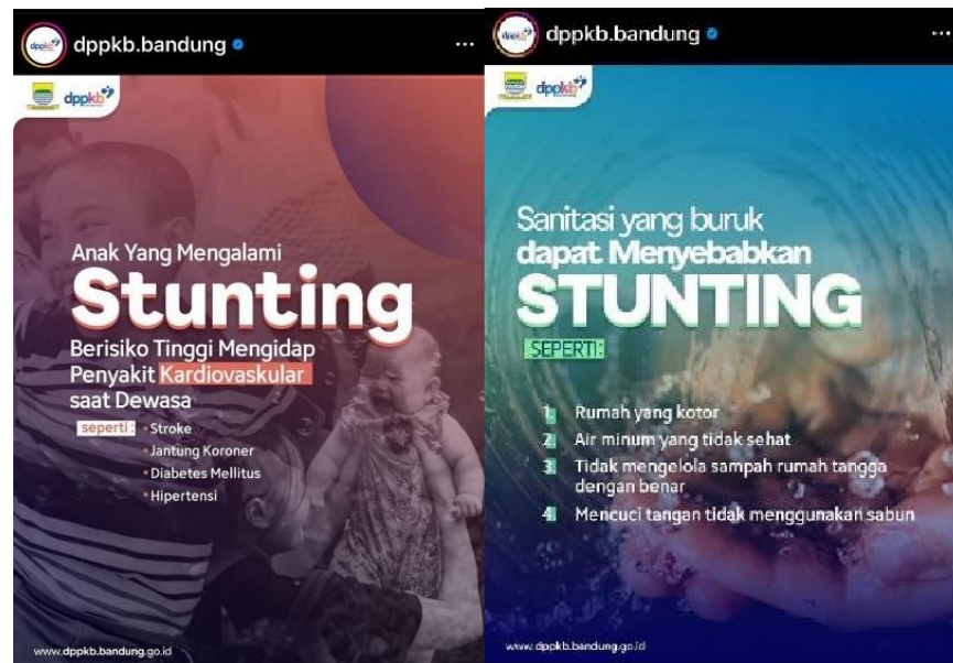
Gambar 1.1 Postingan @dppkb.bandung

DPPKB Kota Bandung (Dinas Pengendalian Penduduk dan Keluarga Berencana Kota Bandung) merupakan instansi pemerintah daerah yang bertanggung jawab atas program-program yang berkaitan dengan pengendalian penduduk dan perencanaan keluarga di Kota Bandung. DPPKB Kota Bandung memiliki akun resmi di platform media sosial Instagram dengan username @dppkb.bandung. Pada upaya melakukan dan mengejar bonus demografi 2045 terkait penurunan stunting, sesuai dengan PERPRES No. 72 Tahun 2021, Pemerintah Kota Bandung memiliki angka target untuk mendorong angka penurunan hingga mencapai 14% (SSGI, 2022). Berdasarkan observasi peneliti dalam akun Instagram nya, DPPKB Kota Bandung juga banyak memberikan informasi terkait dengan kesehatan, salah satunya informasi dalam pencegahan stunting. Hal tersebut dapat dilihat dalam postingan Instagram @dppkb.bandung sebagai berikut.