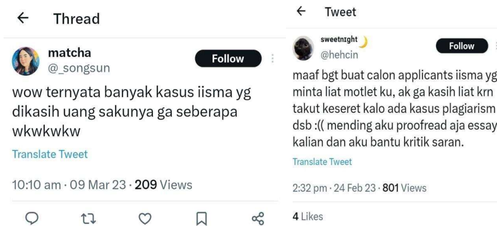
Gambar 1.3 Komentar Negatif terhadap Program IISMA dari Twitter

Adanya kritik serta keluhan dari beberapa mahasiswa Indonesia terhadap program IISMA ini merupakan hasil dari sentimen negatif yang terpantau oleh Brand24. Meskipun proposisi sentimen positif dalam program IISMA masih lebih dominan, respon negatif dari kritik dan keluhan mahasiswa perlu diperhatikan untuk memperbaiki aspek yang belum sesuai dan mempertahankan yang sudah diperbaiki. Sentimen negatif ini terutama muncul di media sosial Twitter, di mana beberapa awardee memberikan testimoni terhadap program kampus merdeka ini dari sisi yang berbeda. Banyak yang membahas mengenai ketidaksesuaian uang saku yang dijanjikan oleh IISMA, juga dalam hal plagiarism dokumen yang sering dibagikan oleh awardee dengan tujuan awal untuk membantu mahasiswa lain yang ingin mengikuti IISMA.