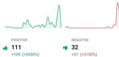
Gambar 1.1 Hasil Analisis Sentimen Positif dan Negatif terhadap Program IISMA

secara online dengan cara memantau percakapan di media sosial dan beberapa platform lainnya. Platform ini juga menyediakan analisis sentimen yang dapat diketahui dengan cepat apa yang dikatakan publik baik itu positif, negatif, maupun netral, serta faktor apa yang mempengaruhi persepsi mereka. Setelah itu dalam platform Brand24 juga membantu dalam mengidentifikasi influencer atau tokoh kunci yang memiliki pengaruh besar dalam percakapan terkait topik tertentu. Hasil dari Brand24 tersebut yaitu laporan dan analisis serta visualisasi data dan grafik yang akan membantu memahami trend, pola, insigh yang dapat digunakan untuk pengambil keputusan strategis. Analisis riset yang dilakukan oleh peneliti tentang analisis sentiment pada IISMA akan menggunakan tools analysis Brand24 untuk mengetahui seberapa banyak sentimen negatif dan positif yang diterima oleh IISMA, lalu seberapa banyak tingkat penyebutan dan jangkauan yang diterima, dan analisis terhadap program IISMA.