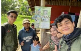
Gambar 1. 1 AR (Augmented Reality)