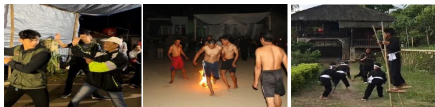
Gambar 1. 3 Permainan tradisional Desa Wisata Margamulya

Sedangkan pada daya tarik budaya, desa ini mempunyai ragam permainan tradisional khas sunda, seperti pertunjukan bola api dan juga dapat merasakan berbaur untuk mencoba rutinitas hidup di desa bersama masyarakat setempat. Beragamnya potensi wisata yang dimiliki oleh Desa Wisata Margamulya tentunya memerlukan pengelolaan yang baik terutama dukungan sumber daya manusia yang mampu beradaptasi dengan perubahan zaman yang ada.