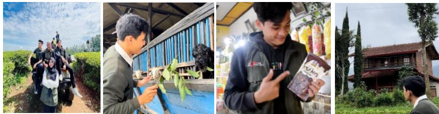
Gambar 1. 2

Desa Wisata Margamulya memiliki banyak potensi yang dapat di kembangkan menjadi daya tarik wisata seperti perkebunan teh, peternakan kambing, UMKM, budaya masyarakat setempat hingga view city light . Di desa ini juga telah banyak berdiri villa dan homestay sebagai sarana akomodasi wisatawan.