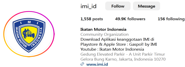
Gambar 1.2 Logo dan Instagram IMI

Adapun berbagai alasan utama menggunakan internet, “Pencarian Informasi” menjadi alasan utama dengan persentase tertinggi sebesar 83,1% dari Populasi atau sebanyak 176,9 Juta Individu. Sementara itu, Meta dalam Data Reportal (2024) menyatakan sebesar 46% dari Populasi yang berusia di atas 13 Tahun atau sebanyak 127,1 Juta Individu adalah Pengguna sosial media Instagram di Indonesia.