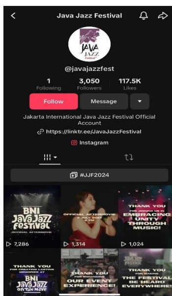
Gambar 1. 2 Media Sosial Tiktok Javajazz

Dalam hal ini Ekspectanica sudah menggunakan media sosial TikTok sebagai sarana promosi, , Berdasarkan pra analisis pada TikTok Ekspectanica terhitung sejak sosial media sosial TikTok ini dibuat mulai April 2023 dan di tahun 2024, event musik Ekspectanica sudah memiliki total pengikut sebanyak 39 ribu serta total jumlah like sebanyak 1,3 juta like di Akun media sosial TikTok mereka dan masih terus bertambah, dalam hal ini Ekspectanica bisa dibilang baru dalam menggunakan media sosial TikTok dalam mempromosikan Festival mereka, namun Ekspectanica tidak semata sebagai festival musik yang menggunakan media sosial TikTok dalam upaya memanfaatkan TikTok dalam mempromosikan event , tetapi sudah banyak yang menggunakan platform ini yang sudah lama menggunakan TikTok dalam upaya promosi festival musik.