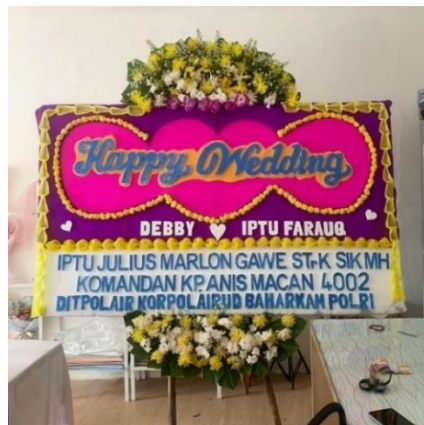
Gambar 1.8 Bunga Papan

Bunga papan adalah sebuah rangkaian bunga dengan menghiasi papan. Biasanya bunga papan digunakan untuk memberikan berbagai ucapan seperti grand opening , wedding atau belangsungkawa. Papan bunga ini dirancang dengan berbagai jenis bunga dan hiasan, menyampaikan pesan