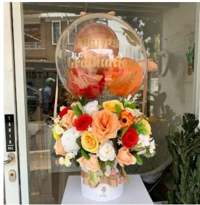
Gambar 1.7 Flowers n Ballon

Flowers n Ballon merupakan bunga yang dihias sebagai penopang balon di atasnya, biasa digunakan sebagai hadiah saat wisuda, ulang tahun ataupun perayaan lainnya. Bouquet bunga dan balon menggabungkan keindahan bunga segar dengan keceriaan balon berwarna-warni. Bouquet ini juga menciptakan tampilan yang meriah dan mempesona untuk merayakan momen spesial.