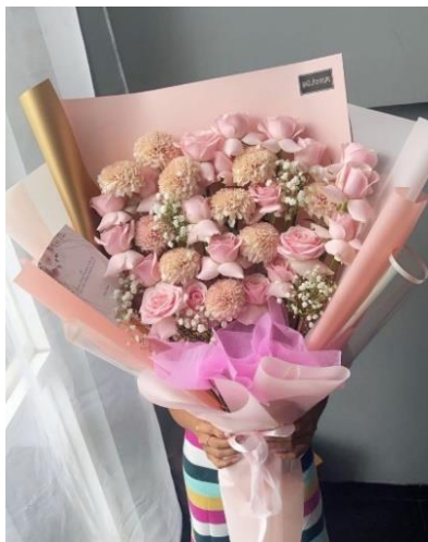
Gambar 1.3 Artificial Flower