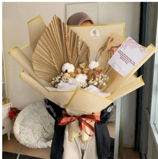
Gambar 1.4 Dried Flower

Dried Flower adalah bunga alami yang telah dikeringkan untuk mempertahankan bentuk dan warnanya. Dried Flower digunakan untuk tujuan dekoratif, baik dalam rangkaian bunga maupun kerajinan. Mereka juga dapat digunakan untuk potpourri, karangan bunga, dan proyek DIY lainnya.