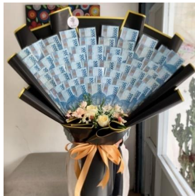
Gambar 1.6 Money Bouquet

Money bouquet merupakan buket bunga yang terbuat dari dried flower dan uang tunai. Money bouquet biasa digunakan sebagai hadiah saat wisuda, ulang tahun ataupun perayaan lainnya. Money bouquet ini menawarkan cara yang kreatif untuk memberikan uang sebagai hadiah, dengan desain yang menarik dan penuh perhatian, membuatnya lebih berkesan dan berharga.