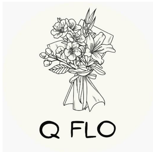
Gambar 1.1 Logo Q Florist