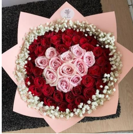
Gambar 1.2 Fresh Flower

Fresh flower merupakan bunga segar yang baru dipetik dan dirangkai dalam keadaan fresh sehingga mengeluarkan wangi alami dari bunga yang dirangkai. Fresh flower biasa digunakan dalam acara lamaran, pernikahan, dan perayaan perayaan lainnya. Bouquet bunga segar ini dirangkai dengan hati-hati, menggabungkan berbagai jenis bunga untuk menciptakan komposisi yang harmonis dan mempesona.