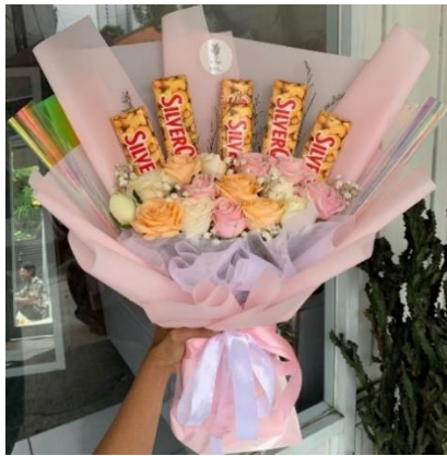
Gambar 1.5 Snack Bouquet

Snack bouquet adalah dimana makanan yang biasanya camilan disusun dan dirangkai menjadi sebuah bouquet . Biasanya snack bouquet berisi camilan seperti cokelat, kue, permen, kacang-kacangan, keripik, dan item makanan ringan lainnya. Kumpulan camilan yang dirangkai seperti bunga ini tidak hanya memanjakan lidah, tetapi juga memberikan sentuhan unik dan menyenangkan pada setiap acara atau perayaan.