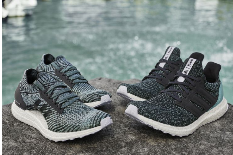
Gambar 1. 5 Adidas UltraBOOST X Parley dan UltraBOOST Parley

menggunakan bahan yang sama, namun dengan model yang berbeda. Perbedaan nya adalah UltraBOOST X Parley menampilkan Adaptive Arch, desain yang lebih cocok untuk Perempuan.