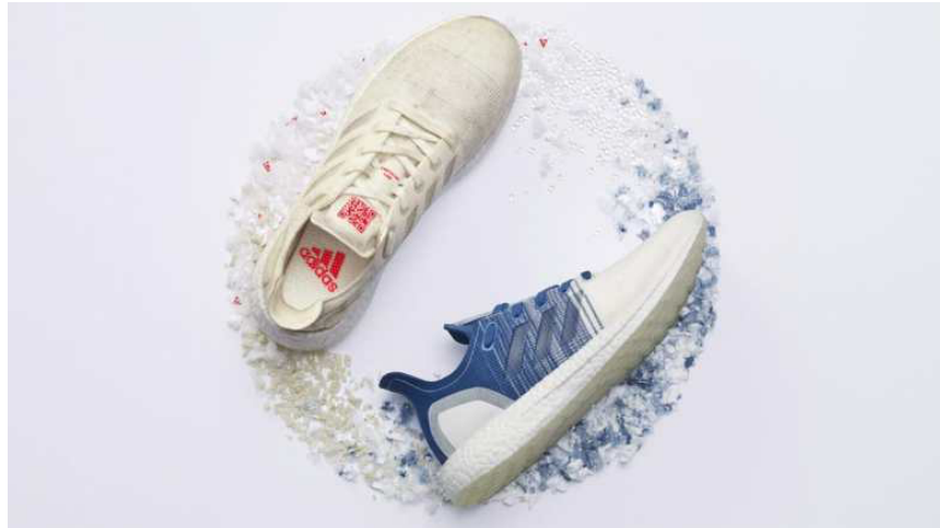
Gambar 1. 6 Adidas futurecraft running loop, salah satu sepatu dalam program Circular Loop

Strategi ketiga yaitu Regenerative Loop . Adidas menyadari bahwa bahkan dengan mendaur ulang semuanya dan merancang produk untuk dibuat ulang, kemungkinan beberapa di antaranya tidak akan berakhir kembali. Itulah mengapa tujuan akhir mereka adalah untuk memastikan bahan-bahan ini pada akhirnya dapat dikembalikan ke alam dengan kerusakan lingkungan yang minimal. Adidas telah bermitra dengan perusahaan seperti Bolt Threads , untuk membuat produk dari bahan alami yang dapat terurai. Ini termasuk membuat benang baru dari protein yang dapat direkayasa untuk tujuan tertentu. Tahun lalu, merek olahraga memamerkan gaun tenis biofabrik di Wimbledon yang mereka rancang bersama Stella McCartney. Seluruh pakaian terbuat dari mikrosilk biofabrikasi ini. (sumber : alphacommerce.xyz )