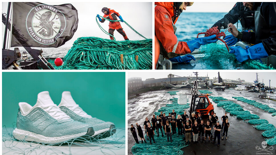
Gambar 1. 4 Kampanye Adidas X Parley

Siluet sepatu Adidas-Parley didesain ulang dengan bagian atas rajutan dan jahitan dekoratif, semuanya terbuat dari plastik daur ulang yang dikumpulkan oleh Parley. Sol luarnya dibuat dari karet daur ulang dan digiling ulang. Semuanya dibuat dari sampah-sampah laut yang mereka kumpulkan. Bahan tersebut dinamakan Primeblue dan Primegreen performance Fabrics .