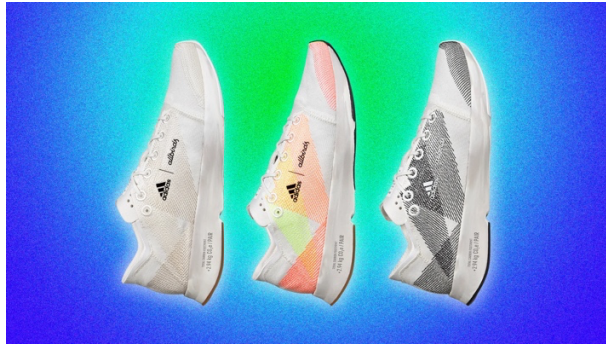
Gambar 1. 7 Adizero x Allbirds 2.94 kg CO 2 e

Kolaborasi mereka menciptakan Adizero x Allbirds 2.94 kg CO 2 e — sepatu lari ultra ringan dengan jejak karbon terendah. Pada produk ini mengganti sintetis berbasis petroleum dengan alternatif alami seperti menggunakan wol, serat pohon, dan tebu. Mereka lembut, bernapas, dan lebih baik untuk planet ini.