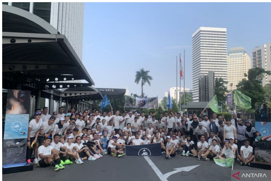
Gambar 1. 8 Event Move For The Planet di Jakarta, Indonesia

Pada tahun 2023 Adidas membuat event dengan nama Move For The Planet, event ini adalah Inisiatif global yang memanfaatkan gerakan kolektif untuk menciptakan dampak bersama. Dalam hal ini, adidas mengajak semua orang dari berbagai tingkatan olahraga di seluruh dunia untuk mengumpulkan menit aktivitas fisik mereka yang dapat dikonversikan menjadi dana bagi proyek-proyek di daerah yang terkena dampak gelombang panas, banjir, dan kondisi cuaca ekstrem lainnya.