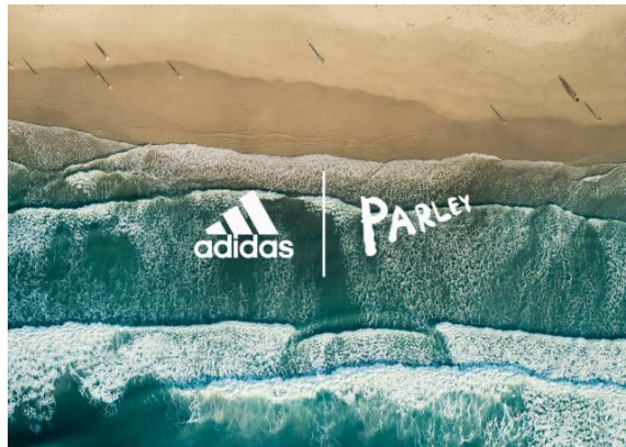
Gambar 1. 3 Kampanye Adidas X Parley

Kampanye lain Adidas adalah salah satu kolaborasi mereka dengan organisasi Parley For The Ocean (Parley) . Parley sendiri adalah salah satu organisasi lingkungan yang bergerak di bidang pengolahan limbah sampah laut. Pada tahun 2015, mereka melakukan kolaborasi dengan mengubah sampah plastik menjadi benang yang ditunen menjadi sepatu lari. Mereka melakukan kampanye ini untuk menyadarkan serta mengajak masyarakat untuk mengurangi pembuangan sampah ke laut.