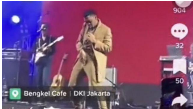
Gambar 1. 1 Aksi Panggung Pamungkas di Synchronize Fest 2022