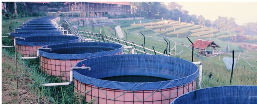
Gambar 1.1 Kondisi kolam ikan sein farm

Permasalahan yang diangkat pada capstone design ini terdapat di lokasi budidaya ikan Sein Farm. Sekemala Integrated Farming atau Sein Farm merupakan salah satu lokasi pertanian terpadu yang ada di kota Bandung. Dikarenakan kurangnya teknologi terpusat dan modern pada peralatan yang digunakan oleh petani ikan, pemeriksaan kolam ikan menjadi dilakukan secara individual dan satu persatu, karena banyaknya kolam ikan dengan posisi antar kolamnya yang cukup jauh, hal ini mengakibatkan produktivitas dari budidaya ikan menjadi kurang efektif dan efisien[1].