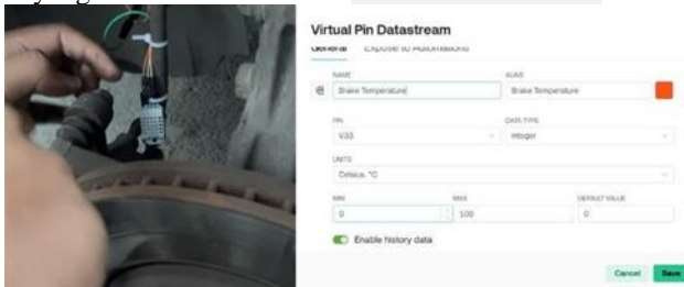
GAMBAR 3.3 Implementasi sensor DHT22

Dalam pengimplementasiannya, sensor DHT22 di pasang dalam 5 cm di belakang kaliper rem mobil, selanjutnya sensor DHT22 akan membaca perubahan resistansi pada kaliper rem mobil yang diakibatkan oleh perubahan suhu dan data yang dibaca oleh sensor akan dikirimkan ke ESP32.