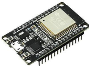
GAMBAR 2.2 ESP32

ESP32 Series adalah sebuah chip combo Wi-Fi 2,4GHz dan bluetooth yang dirancang dengan teknologi 40nm low power . ESP32 menawarkan berbagai fitur dan spesifikasi yang menjadikannya pilihan yang populer untuk berbagai macam aplikasi IoT ( Internet of Things ). Spesifikasi dasar ESP32 sebagai berikut