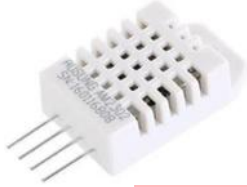
GAMBAR 2.1 DHT22

Sensor DHT22 untuk mengukur suhu pada kaliper rem mobil. Pengujian dilakukan dengan menempatkan sensor di belakang kaliper rem mobil, suhu yang terbaca oleh sensor selanjutnya di kirimkan ke Blynk cloud melalui mikrokontroler. Dalam pengembangan alat ini, sensor DHT22 digunakan untuk mengetahui suhu pada kaliper rem mobil melalui perubahan resistansi, selanjutnya DHT22 menggunakan protokol komunikasi 1-wire untuk mengirimkan data ke mikrokontroler ESP32