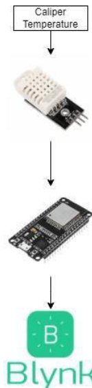
GAMBAR 3.2 Perancangan sensor DHT22

Pada caliper temperature menggunakan sensor DHT22 untuk mengukur suhu pada kaliper rem mobil. Pengujian dilakukan dengan menempatkan sensor di belakang kaliper rem mobil [4], suhu yang terbaca oleh sensor selanjutnya di kirimkan ke Blynk cloud melalui mikrokontroler