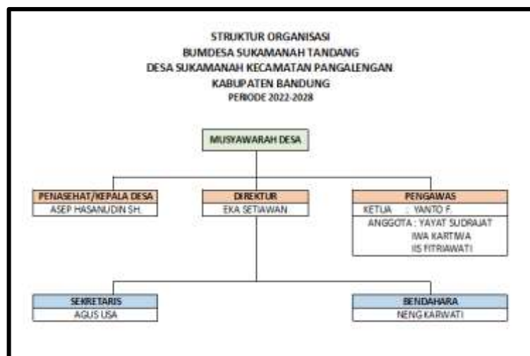
Gambar 1. 4 Struktur Organisasi BUMDes Sukamanah Tandang

BUMDes Sukamanah Tandang memiliki masa kepengurusan yang ditunjuk langsung oleh Kepala Desa Sukamanah Tandang, dalam menjalankan fungsi dan tugas BUMDes. Berikut merupakan struktur organisasi pada BUMDes Sukamanah Tandang, Desa Sukamanah, Kecamatan Pangalengan pada masa kerja 2022-2028. Dalam struktur organisasi BUMDes Sukamanah Tandang berdasarkan hasil dari putusan Musyawarah Desa, didapatkan :