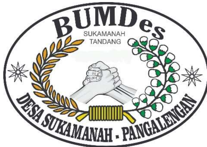
Gambar 1. 3 Logo BUMDes Sukamanah Tandang