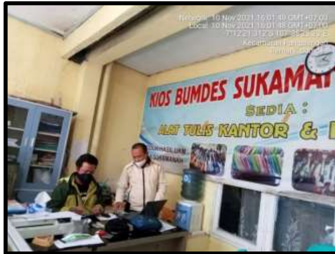
Gambar 1. 2 Kantor dan Unit Usaha BUMDes Sukamanah Tandang