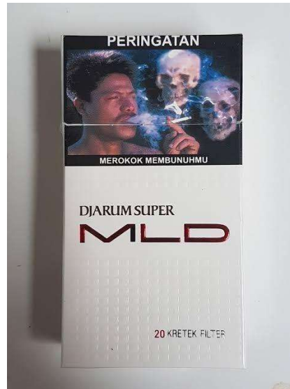
Gambar 1. 1 Contoh Peringatan dalam Label Rokok

Label peringatan “Merokok membunuhmu” adalah bagian dari cara komunikasi yang dianggap efektif dalam rangka meningkatkan kesadaran akan risiko kesehatan. Harapannya, komunikasi peringatan kesehatan yang efektif pada bungkus rokok dapat mendorong perokok untuk berhenti dan mencegah mereka yang bukan perokok untuk mulai merokok. Strategi komunikasi melalui label peringatan dalam bungkus rokok adalah sebuah strategi global yang banyak dilakukan di berbagai negara di dunia (Moodie et al., 2020), dan sudah lama disosialisasikan oleh WHO karena dianggap menjadi strategi paling efektif dalam mengendalikan jumlah perokok. Bahkan, WHO memberikan standar seperti apa pola komunikasi yang bisa dipergunakan tersebut (World Health Organization, 2002).