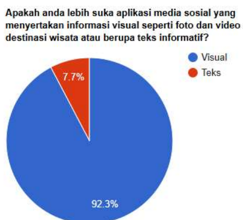
Gambar 1.2 Diagram lingkaran survei model aplikasi

Berdasarkan hasil survei yang dilakukan terhadap 26 orang responden, sebanyak 91.3% responden lebih memilih agar aplikasi media sosial menampilkan foto dan video tempat destinasi wisata dibandingkan teks informatif destinasi wisata.