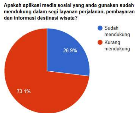
Gambar 1.1 Diagram lingkaran survei masalah

Analisa masalah juga dilakukan dengan melakukan survei kepada masyarakat umum untuk menganalisa masalah yang dihadapi mereka dengan menanyakan apakah aplikasi media sosial yang mereka gunakan sudah mendukung dalam melakukan perencanaan kegiatan berwisata atau belum.