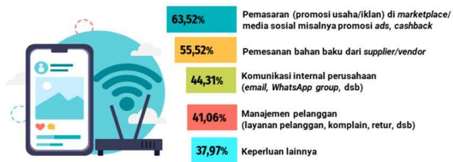
Gambar 1. 1 Presentase Usaha E-Commerce Pemanfaatan Layanan Internet, Tahun 2021

Setiap perusahaan saat ini harus meningkatkan keterampilan sumber daya manusianya untuk menguasai teknologi jika mereka ingin mencapai menghadapi digitalisasi sehingga perusahaan yang terlibat dapat menggunakannya untuk memenuhi kebutuhan tenaga kerja. Banyak jenis aktivitas di Indonesia telah mengandalkan berbagai platform untuk memudahkan aktivitas sehari-hari. Platform digital memungkinkan pegawai berkomunikasi dan bekerja sama dengan lebih baik sehingga mereka dapat membuat kontribusi yang lebih baik untuk perusahaan sambil tetap menjaga kerahasiaan mereka. Dengan menggunakan platform ini, pegawai akan lebih produktif dalam pekerjaannya karena mereka dapat menyelesaikan pekerjaan dengan lebih mudah dan lebih efektif serta efisien dari segi waktu. Menurut Mohamed et al. (2017), media sosial telah menjadi kebutuhan bagi organisasi karena dapat meningkatkan produktivitas atau prestasi kerja karyawan (Albuflasa, 2019). Jika sumber daya manusia menguasai teknologi yang digunakan oleh perusahaan, penggunaan platform digital dapat meningkatkan efisiensi pekerja dan perusahaan. Jika mereka memiliki kemampuan yang cukup untuk menjalankan aktivitas kerja berbasis internet, proses kerja mereka akan menjadi lebih efektif dari segi material maupun non material. Tingkat output yang lebih tinggi menunjukkan bahwa karyawan lebih produktif.